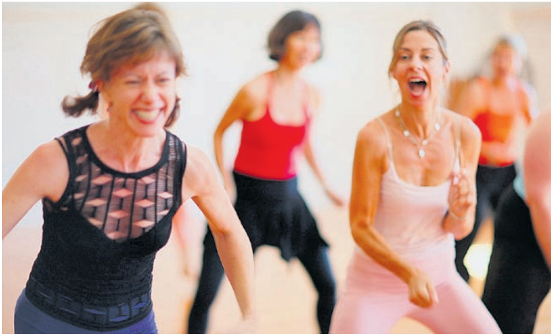
Tanz der Sinne statt Sport bis zum Umfallen: Fitnessbewegungen wie Nia wollen den Körper, den Geist und die Seele in Bewegung versetzen.